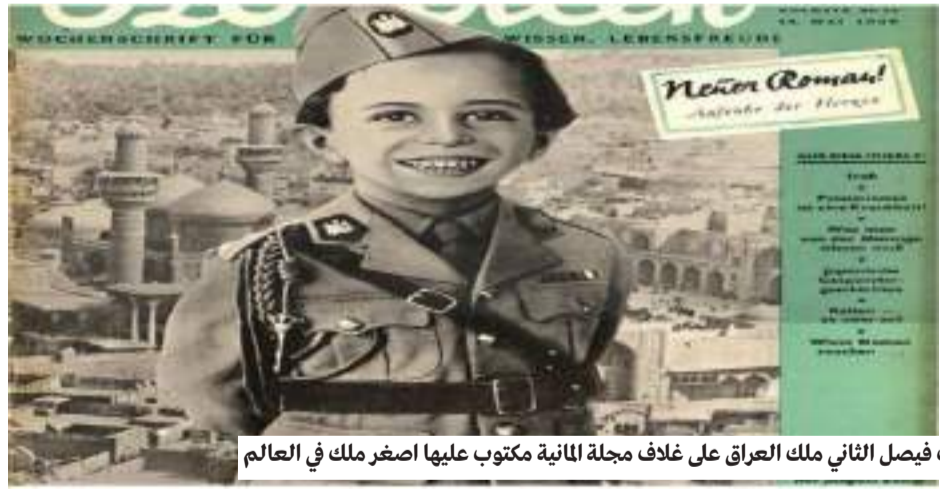
الملك فيصل الثاني ملك العراق على غلاف مجلة المانية مكتوب عليها اصغر ملك في العالم