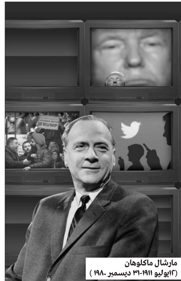
مارشال مكلوهان (١٠ يوليو ١٩١١- ٣١ ديسمبر ١٩٨٠)

يتقاطع هذا الدور مع رؤية بازان للحرية التأملية، ومع تصور