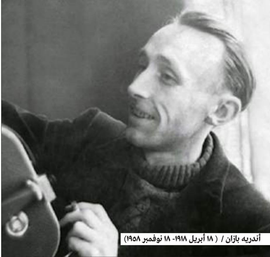
أندريه بازان / (١٨ أبريل ١٩١٨- ١٨ نوفمبر ١٩٥٨)

يميز دولوز بين مرحلتين أساسيتين في تطور اللغة السينمائية. في «سينما الصورة-الحركة»، يكون الزمن خاضعاً لمنطق الحركة والفعل والسببية، حيث تتقدم الأحداث وفق تسلسل منطقي واضح. أما في «سينما الصورة-الزمن»، فيتحرر الزمن من هذا المنطق، ويصبح موضوعاً للتأمل بذاته. هنا تتفكك الحبكة التقليدية، وتراجع مركزية الفعل، لتحل محلها حالات الوعي، والانتظار، والذاكرة، والضياح، واللايقين.