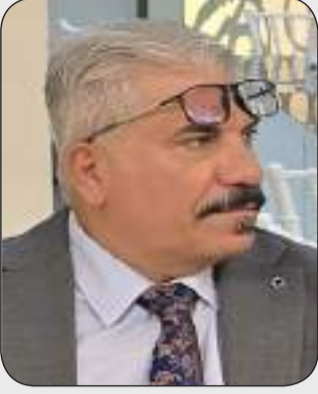
بقلم علي شحونه الكعبي