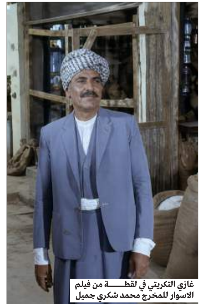
غازي التكريتي في لقطة من فيلم الاسوار للمخرج محمد شكري جميل