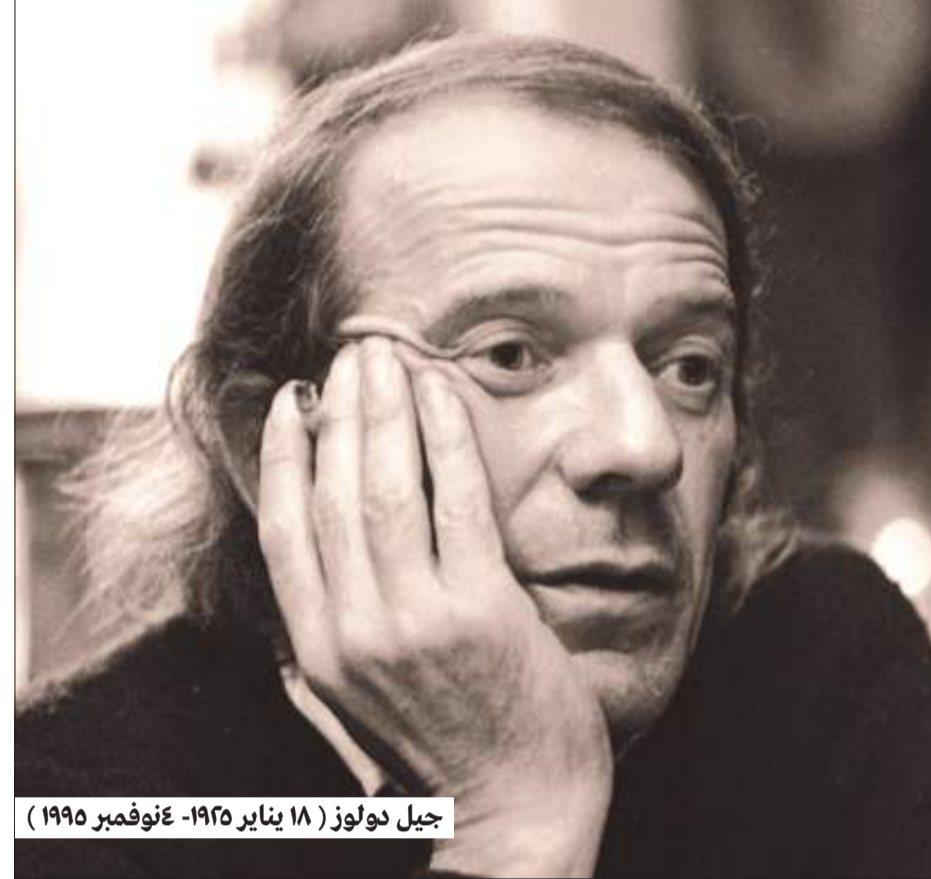
جيل دولوز (١٨ يناير ١٩٢٥- ٤ نوفمبر ١٩٩٥)

ينقل جيل دولوز التفكير في السينما إلى مستوى فلسفي أكثر تجريداً، حين يعتبرها الفن الوحيد القادر على التفكير بالزمن مباشرة. ففي كتابيه «الصورة-الحركة» و«الصورة-الزمن»، لا يقدم دولوز تاريخاً للسينما بقدر ما يقدم فلسفة للصورة المتحركة، حيث تصبح السينما أداة تفكير لا تقل أهمية عن الفلسفة ذاتها.