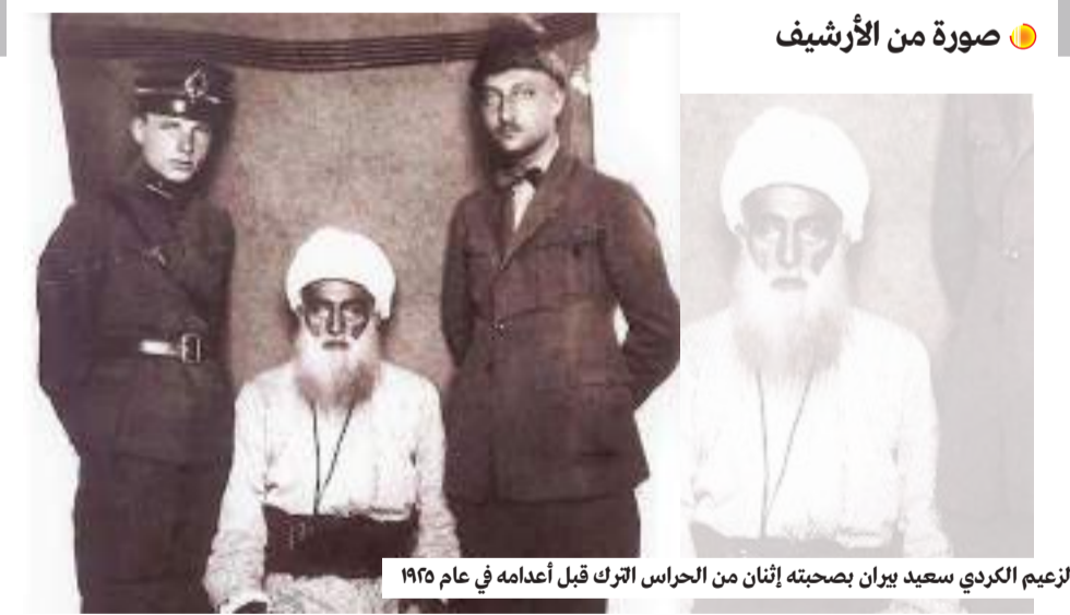
الزعيم الكردي سعيد يران بصحبة إثنان من الحراس الترك قبل اغتياله عام ١٩٢٥