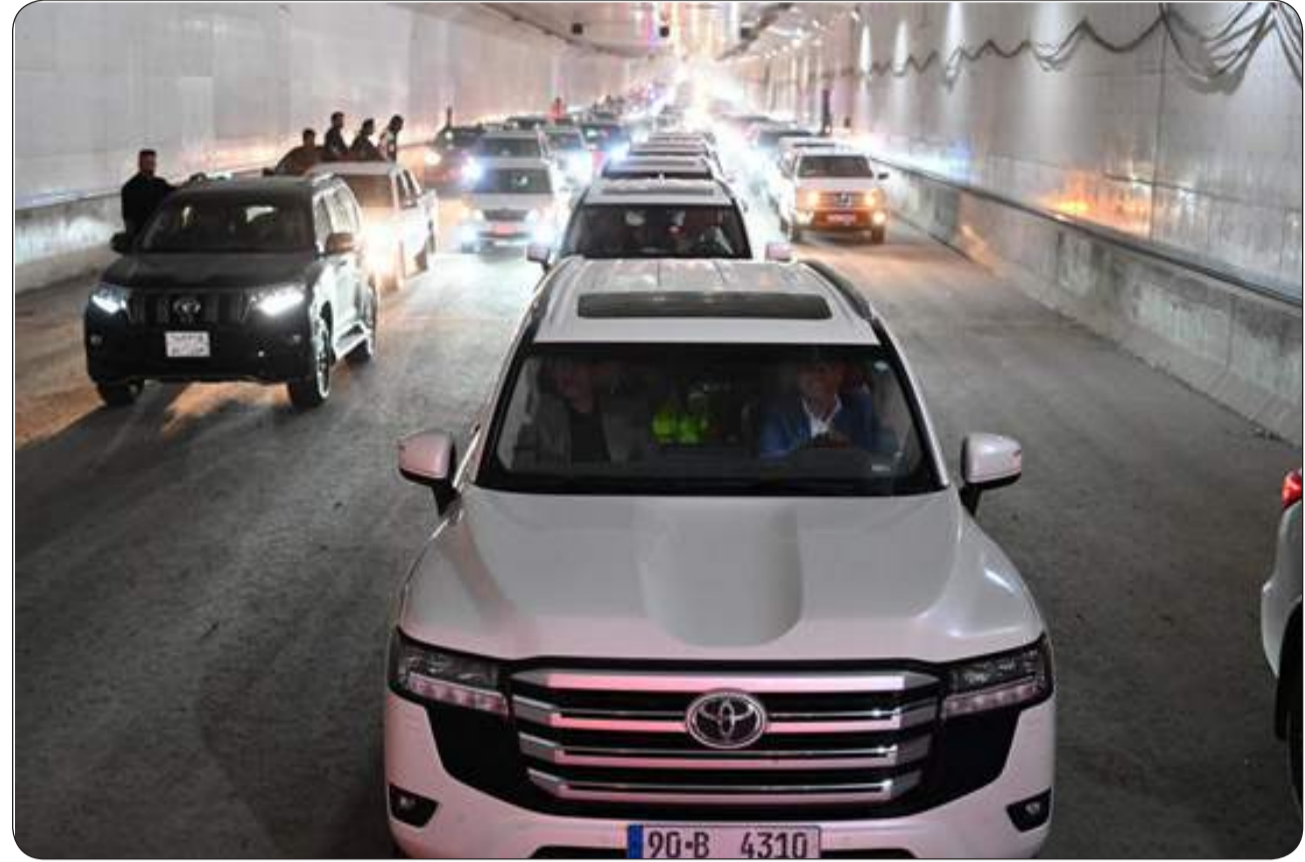
المشرق - خاص: السبت، افتتاح النفق المغمور أمام عبور عشرات المركبات ضمن فعالية جماهيرية مفتوحة شهدها مشروع نفق الموائى المغمور، أعلن المكتب الإعلامي في وزارة النقل، اليوم أحد مشاريع ميناء الفاو الكبير. وقال المكتب