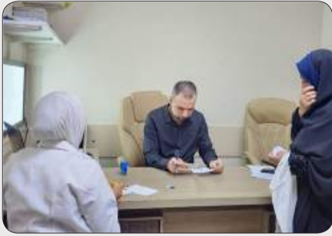
أعد المشرق - خاص:

استقبلت استشارية الجراحة العصبية في مستشفى الشهيد غازي الحريري للجراحات التخصصية بمدينة الطب (١٤٣٩) مراجع خلال شهر نيسان، إذ تم استقبال الحالات من جميع المحافظات إضافة الى جرحى القوات الأمنية وتستقبل الاستشارية الحالات المصابة بالانزلاقات وكسور الفقرات والتشوّهات الخلقية للفقرات وأورام الدماغ وأمراض الأعصاب وتشوهات الجمجمة والعمود الفقري.