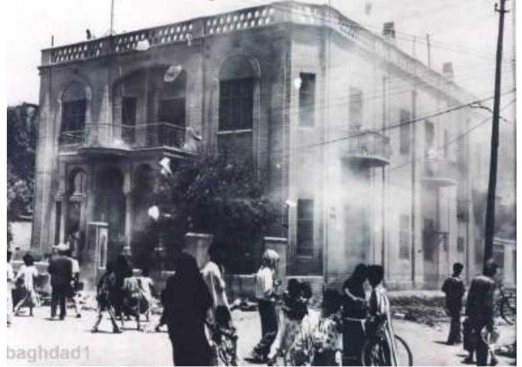
(NY20-JULY 23)MOB-GUTTED BRITISH INFORMATION CENTER BUILDING IN BAGHDAD-Curious Iraqis view the sacked British information center building in Baghdad. The building was wrecked by anti-western demonstrators during the revolt early last week that ended the regime and life of young King Faisal.gwa1707LN1958