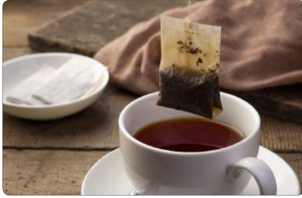
مادة تصنع الكيس نفسها، أو التلوث خلال الإنتاج، أو على أكياس الشاي فقط، إذ قد تحتوي المشروبات تسرب مركبات كيميائية، إلا أن تحديد المصدر الدقيق

تثير أكياس الشاي مخاوف صحية متزايدة بعد أن كشفت أبحاث حديثة أنها قد تطلق مليارات الجزيئات البلاستيكية الدقيقة والنانوية في كوب واحد، ما يثير تساؤلات حول تأثيرها على صحة الإنسان. وتشير دراسات علمية إلى أن هذه الجسيمات المتناهية الصغر قد تنتقل إلى الجسم عبر الطعام والشراب، حيث يمكن أن تستقر في الأنسجة، فيما لا تزال آثارها الصحية الطويلة المدى قيد البحث، رغم وجود مؤشرات أولية تربط التعرض لها بتأثيرات خلوية مختلفة. ووفق تحليل شمل ١٩ دراسة أجراها باحثون في إيران والمملكة المتحدة، قد يحتوي كيس الشاي الواحد على نحو ١,٣ مليار جسيم بلاستيكي وهو جاف، بينما قد يرتفع العدد إلى حوالي ١٤,٧ مليار جسيم بعد النقع في الماء الساخن، نتيجة تفكك المواد بفعل الحرارة. وتظهر النتائج أن الأكياس المصنوعة من النايلون أو البولي إيثيلين تيريفثال (PET) تطلق كميات أكبر من الجسيمات عند التعرض للماء القريب من الغليان، مقارنة بمواد أخرى. ويرجح العلماء أن مصدر هذه الجسيمات قد يكون