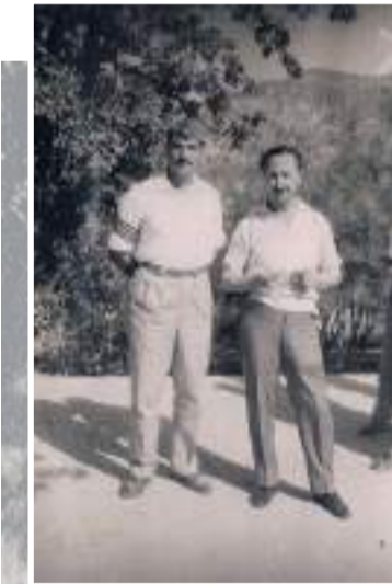
الوصي عبد الإله في مصيف سرسك ١٩٥٧