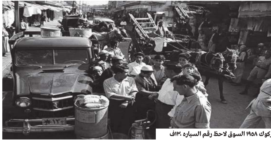
كروك ١٩٥٨ السوق للاحظر رقم السيارة ١٣١٢