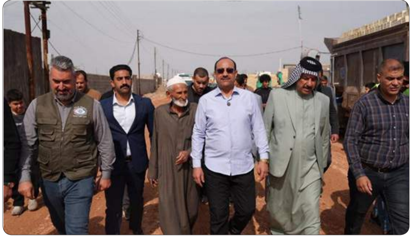
المشرق - خاص: أجرى محافظ بغداد المهندس عطاون (المعامل)، متابعة سير الأعمال الجارية ضمن مشاريح تطوير مناطق شرق القناة، والاطلاع على نسب الإنجاز المتحققة على أرض الواقع،