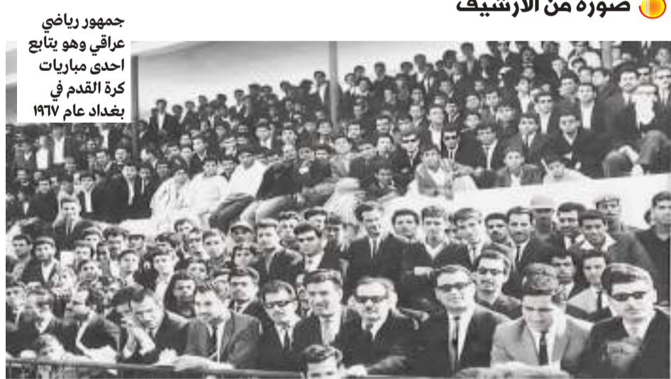
جمهور رياضي عراقي وهو يتابع إحدى مباريات كرة القدم في بغداد عام ١٩٦٧