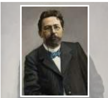
• أنطون تشيخوف

الحياة فخّ خبيث، حين يصل مفكّر ما إلى النضج والوعي الكامل، لن يتخلص من الشعور بأنه ضحية فخّ لا فرار منه.