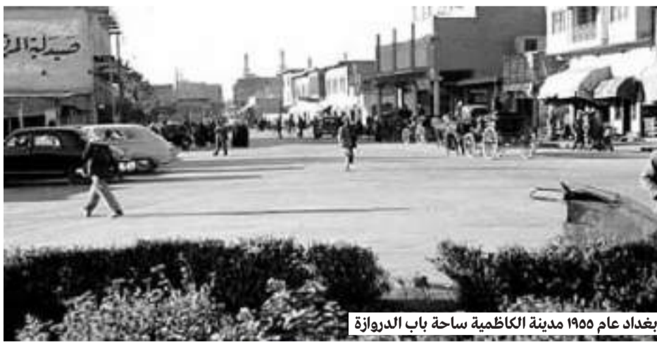
بغداد عام ١٩٥٥ مدينة الكاظمية ساحة باب الدروازة